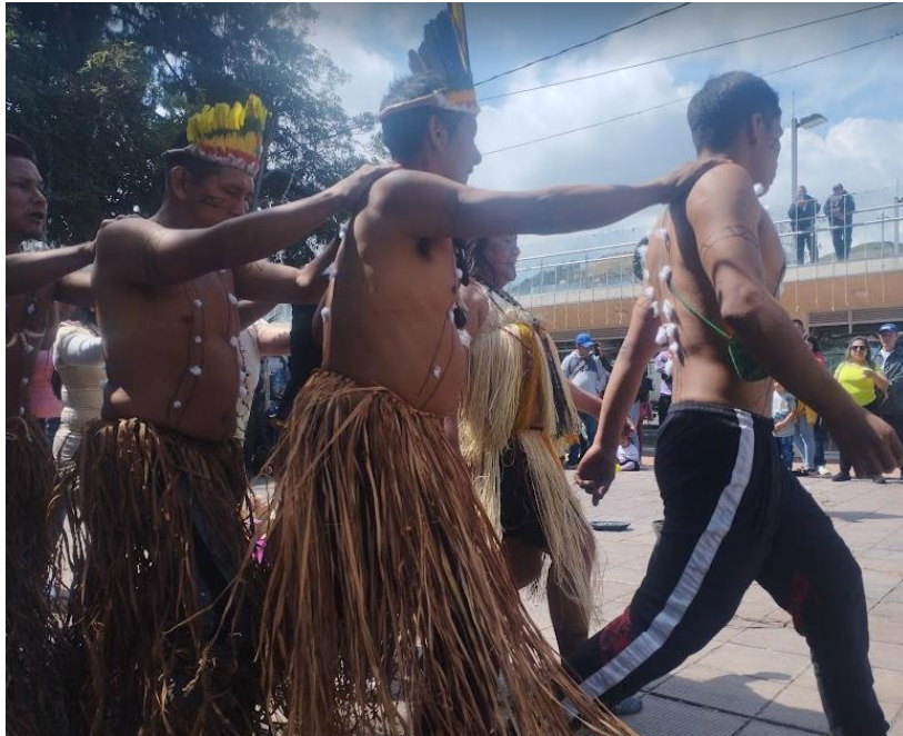
PRESENTACION PUEBLO INDIGENA ANDOQUE