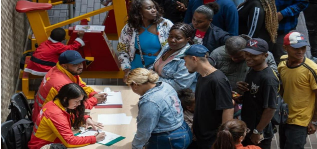
Tabla 6. Escenario Jornada Electoral 2025 - IDPAC 2025

fortalecimiento de la participación ciudadana y la articulación interinstitucional liderada por el IDPAC.