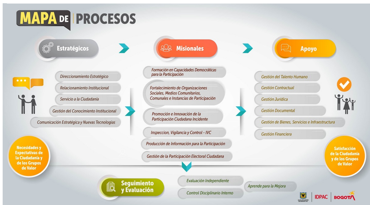
Ilustración 2. Mapa de Procesos Institucional IDPAC

Además, este modelo permite medir y mejorar los resultados de manera constante, garantizando que las acciones del Instituto Distrital de la Participación y Acción Comunal -IDPAC tengan un impacto real en los territorios, aumenten la confianza de la ciudadanía en las instituciones y promuevan una participación inclusiva y sostenible. En conjunto, el mapa de procesos refleja un enfoque de gestión orientado a entregar valor público y a generar beneficios tangibles para la comunidad.