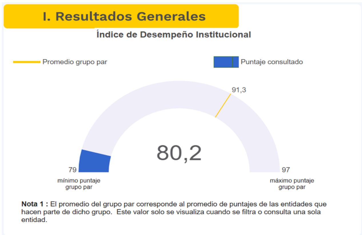
Ilustración 4. Resultados Índice de Desempeño Institucional - IDI - IDPAC 2024

El análisis del IDI por política institucional refleja el nivel de avance y cumplimiento en la implementación de las 19 políticas que orientan la gestión del IDPAC. Los resultados evidencian un desempeño general positivo, con puntajes que oscilan entre 62,5 y 100 puntos.