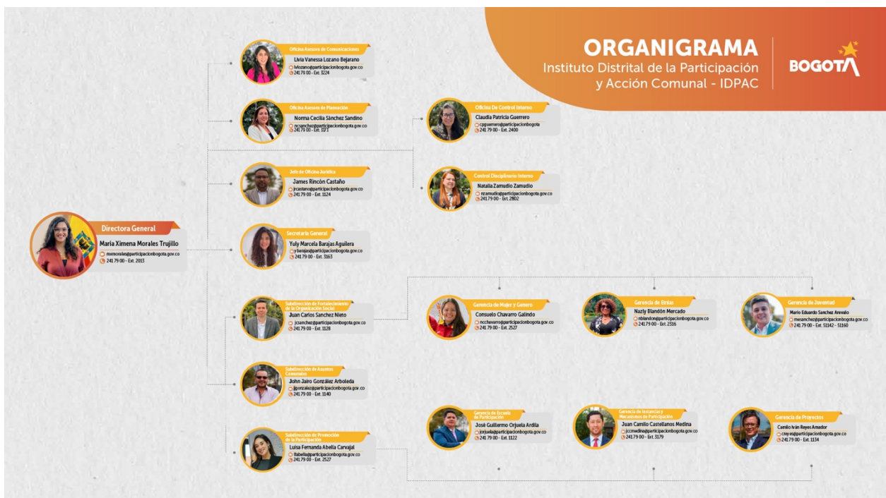
Ilustración 1. Organigrama IDPAC