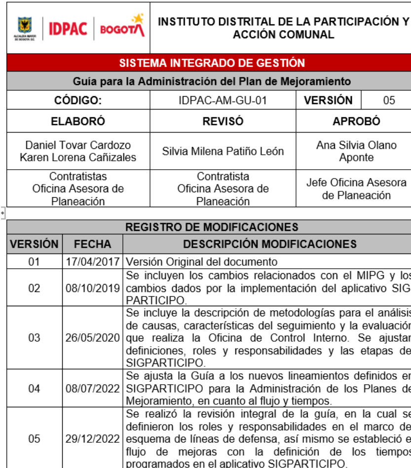
Ilustración 2: Captura de pantalla rotulo control de cambios “Guía para la Administración del Plan de Mejoramiento”