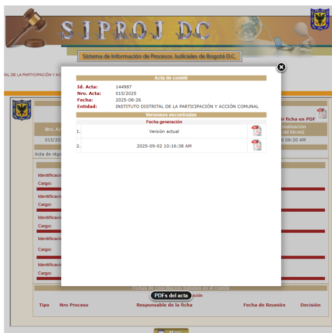
Ilustración 3: Consulta SIPROJWEB - Actas del Comité de Conciliación