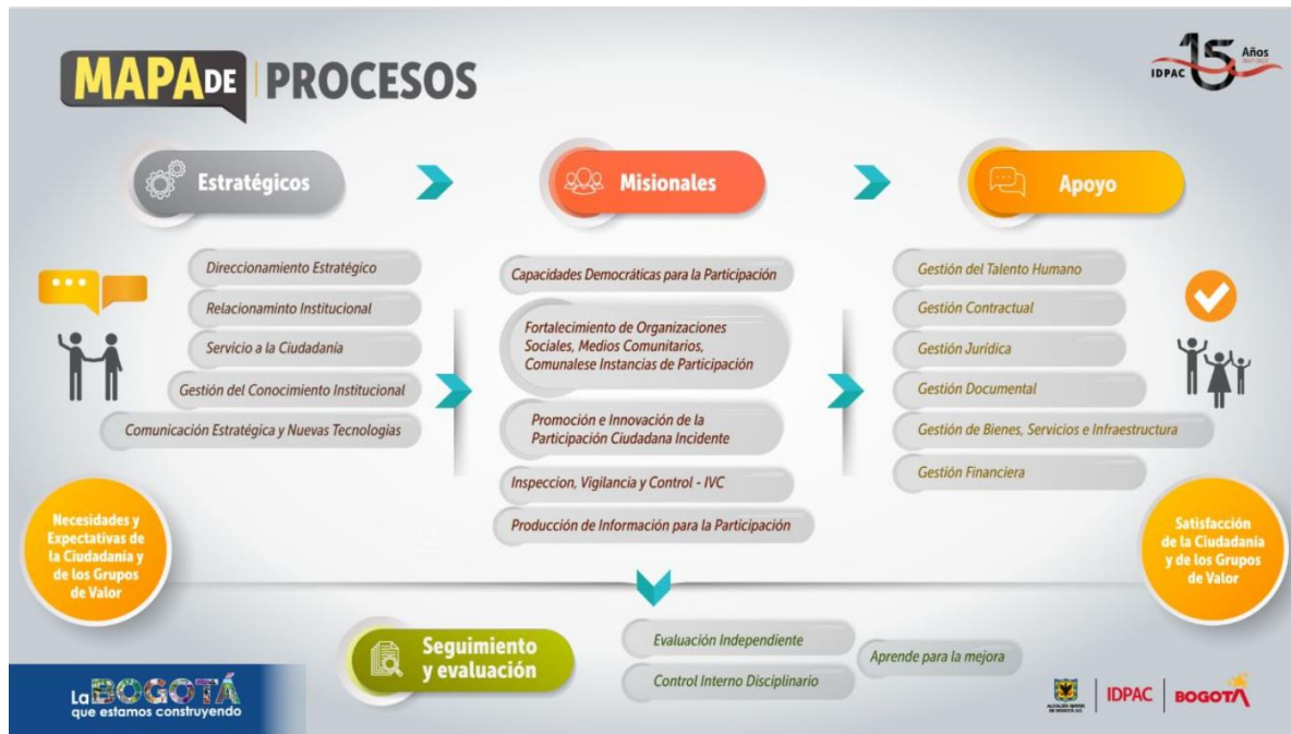
Ilustración 2. Mapa de procesos