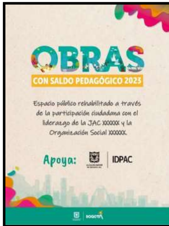
CARA 1 y 2