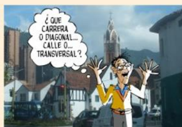
Ilustración de Bogotá animada