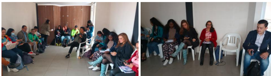
Fotografías sesión agosto 21 de 2025 Comisión Local Intersectorial de Participación de La Candelaria en Casa Zipa