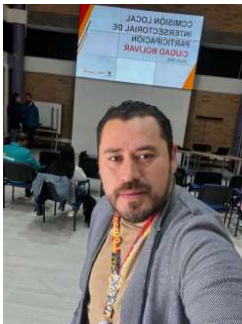
Imagen 2. Reunión CLIP localidad de Ciudad Bolívar mes de Julio