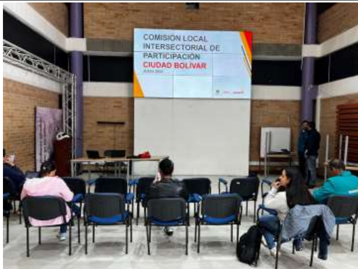
Imagen 1. Reunión CLIP localidad de Ciudad Bolívar mes de Julio