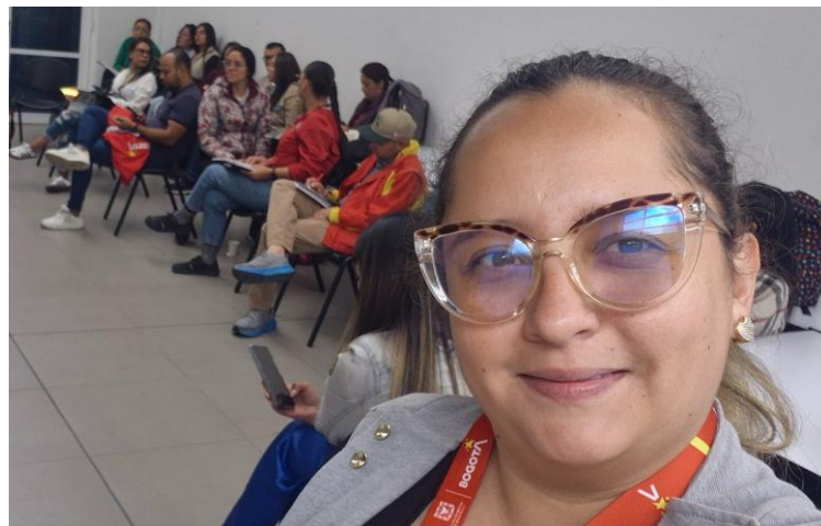
Ilustración 6 – UAT Julio