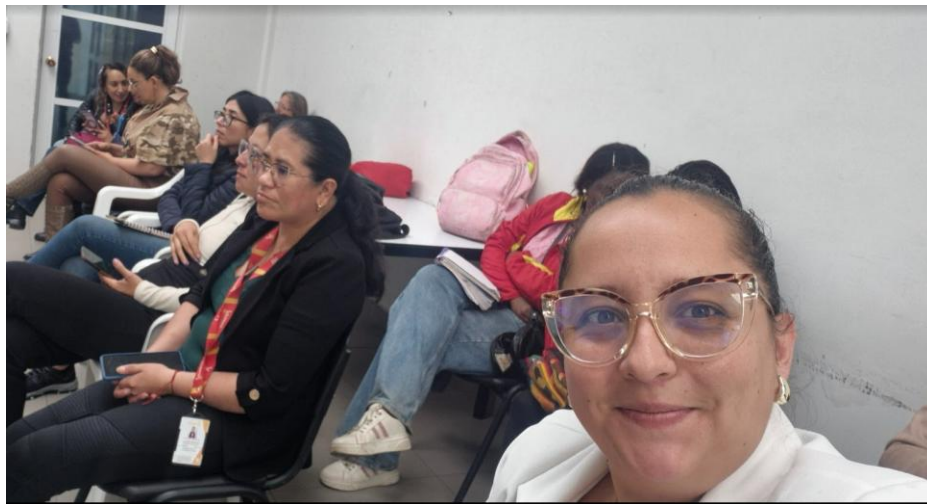
Ilustración 4 – UAT Extraordinaria