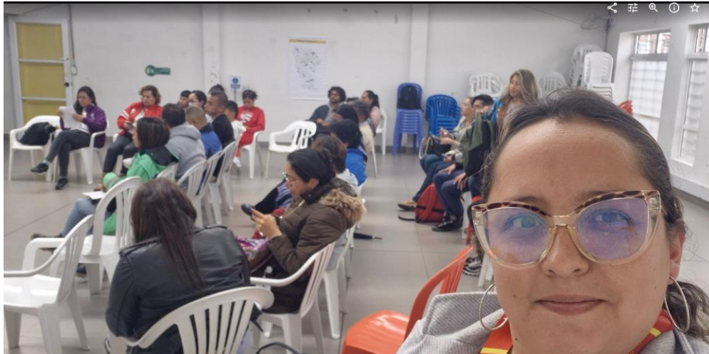
Ilustración 5 – CLOPS productividad