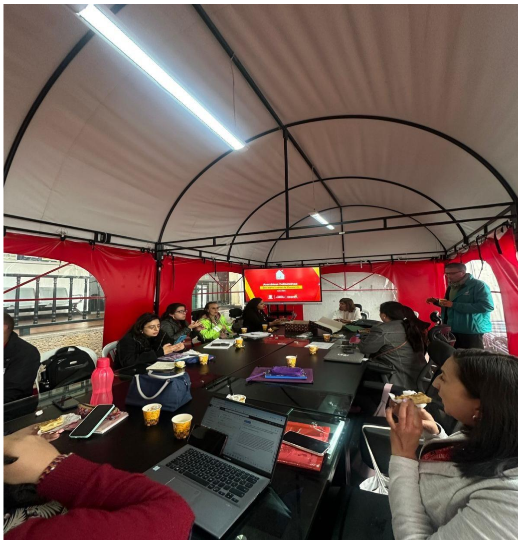
Ilustración 1: REUNION CLIP SUBA