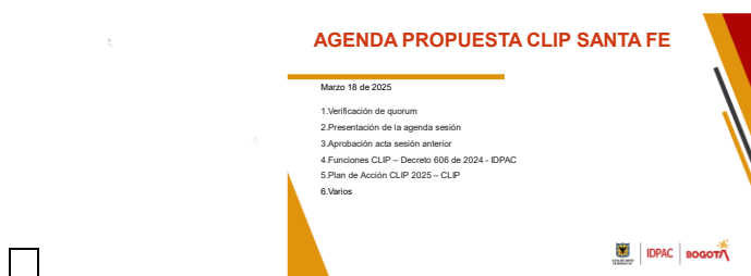
Imagen Agenda CLIP Santa Fe marzo 18 de 2025