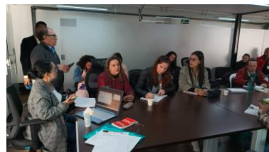
Fotografías sesión CLIP Santa Fe marzo 18 de 2025 en la Alcaldía Local