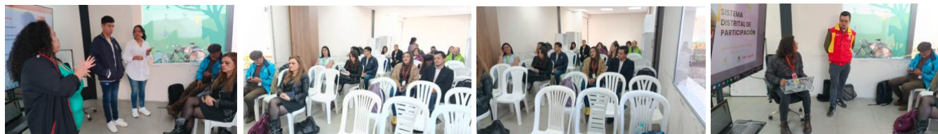
Fotografías sesión mayo 8 de 2025 Comisión Local Intersectorial de Participación de La Candelaria en Casa Zipa