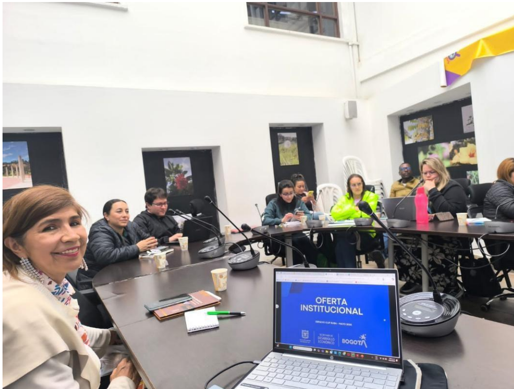
Ilustración 1: Reunión CLIP-Suba

El IDPAC informó que fue enviado por el chat el Reglamento Interno de la CLIP, el cual deberá ser leído por todos los delegados. Su socialización se realizará en la próxima sesión, programada para el jueves 5 de junio de 2025 a las 2:00 p.m., en las instalaciones de la Alcaldía Local de Suba, salón El Hangar.