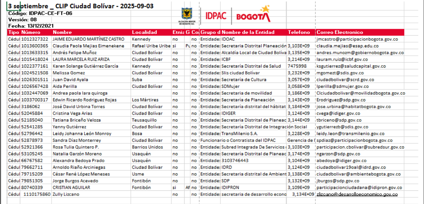
Imagen 4. Listado Asistencia CLIP localidad de Ciudad Bolívar mes de Septiembre