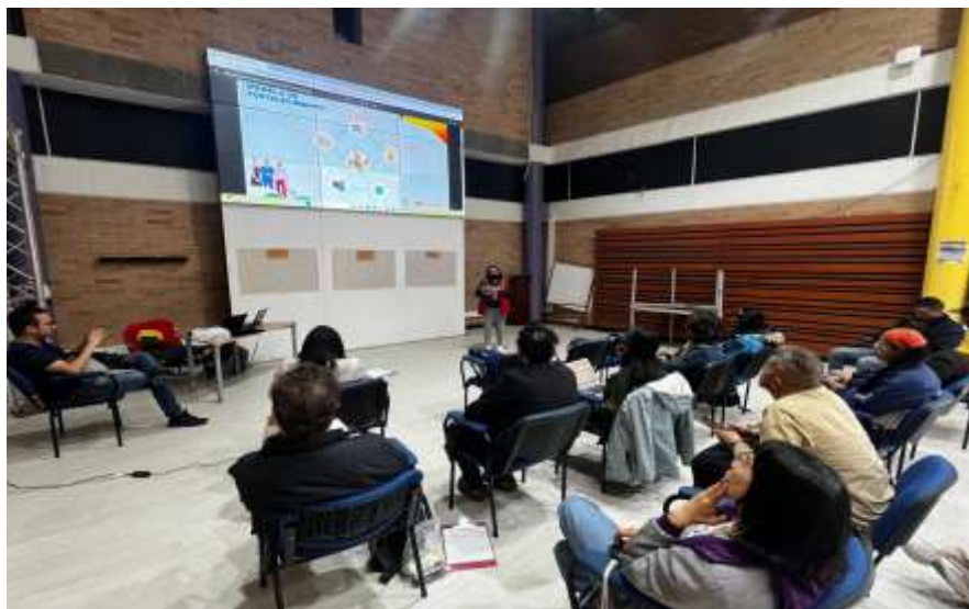
Imagen 1. Reunión CLIP localidad de Ciudad Bolívar mes de Septiembre