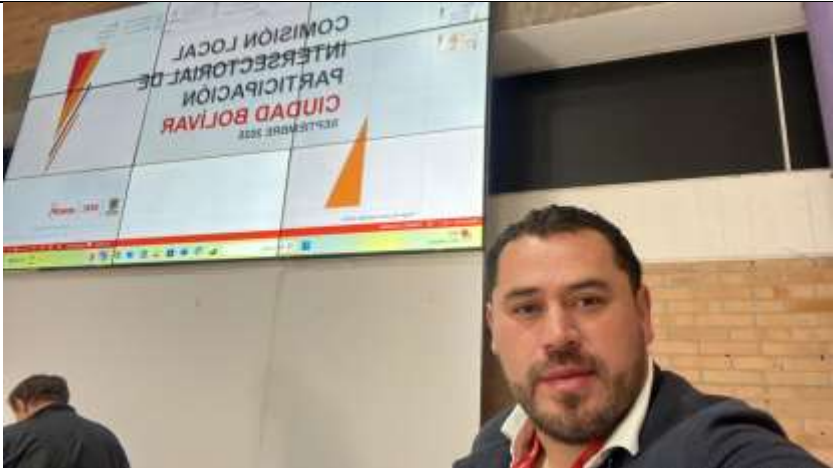
Imagen 3. Reunión CLIP localidad de Ciudad Bolívar mes de Septiembre