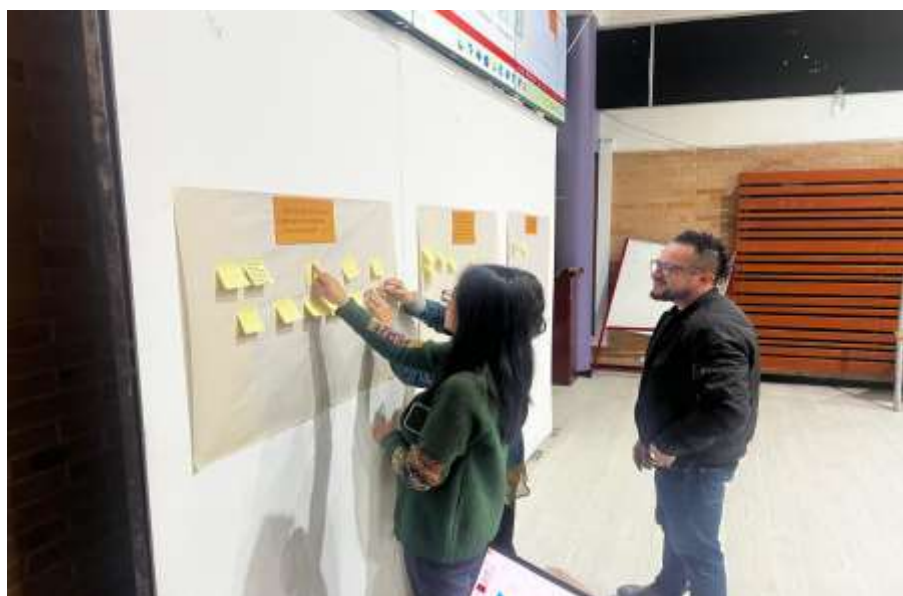
Imagen 2. Reunión CLIP localidad de Ciudad Bolívar mes de Septiembre