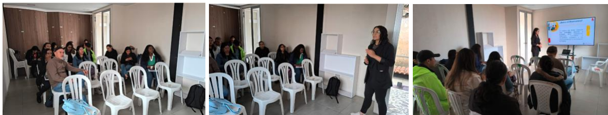
Fotografías sesión septiembre 10 de 2025 Comisión Local Intersectorial de Participación de La Candelaria