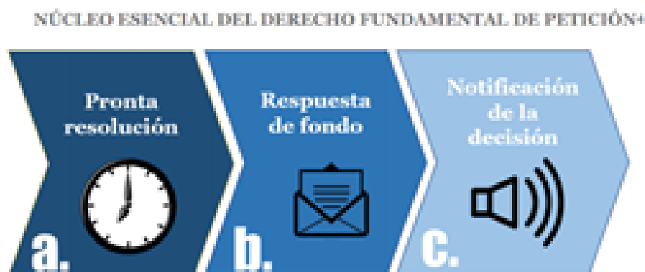
Imagen tomada del Manual para la Gestión De Peticiones Ciudadanas – Sec. General (2020)

De acuerdo con la jurisprudencia de la Corte Constitucional[5], la garantía fundamental de petición, “(...) promueve un canal de diálogo entre los administrados y la administración, “cuya fluidez y eficacia constituye una exigencia impostergable para los ordenamientos organizados bajo la insignia del Estado Democrático de Derecho” (...) esta garantía tiene dos componentes esenciales: (i) la posibilidad de formular peticiones respetuosas ante las autoridades, y como correlativo a ello, (ii) la garantía de que se otorgue respuesta de fondo, eficaz, oportuna y congruente con lo solicitado. Con fundamento en ello, su núcleo esencial se circunscribe a la formulación de la petición, a la pronta resolución, a la existencia de una respuesta de fondo y a la notificación de la decisión al peticionario. (...) ” (Negrita y subrayado fuera de texto).